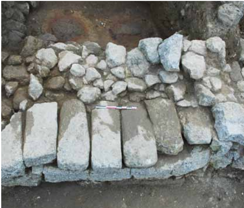
Stèles en remploi dans le parement externe du rempart archaïque de Saint-Blaise (Martigues), au niveau du couloir d'accès.

L'aspect hétérogène témoigne de l'absence de fabrication de série. Les stèles étaient le plus souvent directement plantées dans le sol ou placées dans des socles en pierre, éventuellement sur des podiums rudimentaires. Certaines devaient être protégées ou associées à des portiques. Assimilées à des ex-votos, ces offrandes étaient probablement réalisées en dehors d'ateliers spécialisés et déposées dans des sanctuaires par des individus ou des familles.