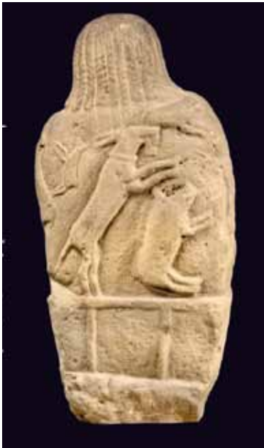
Statue du Coutarel, Poulan-Pouzols (Tarn), musée Toulouse-Lautrec

A côté, la statue du Coutarel reste une œuvre assez méconnue. Une analyse stylistique récente invite à voir deux phases bien distinctes. Dans son état initial, que l'on peut dater du VI e ou du début du Ve s. av. J.-C., un personnage est représenté muni d'un torque et peut-être d'une hache, avec une coiffure à mèche torsadée reprenant étonnamment celle d'un kouros grec. Une deuxième phase, à la fin de l'âge du Fer ou du début de l'Antiquité, met en scènes des animaux sauvages ou domestiques. L'altération ancienne de la face avant laisse envisager la possibilité d'une mutilation ou une désacralisation de l'image.