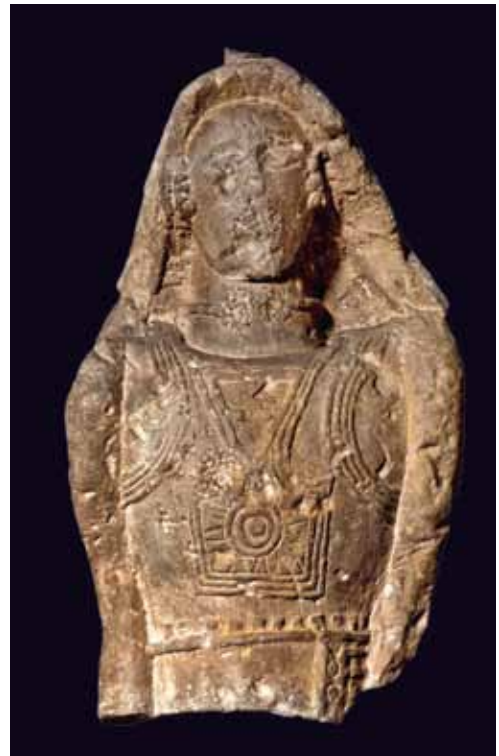
Guerrier de Grézan, Nîmes (Gard), musée archéologique de Nîmes

Pour le guerrier de Grézan, la tête et les épaules sont protégées par un casque couvrant de type Sainte-Anastasie, probablement en cuir, surmonté d'un cimier. Le cou est paré d'un torque. Le torse et le dos sont vêtus d'une cuirasse vraisemblablement en cuir, équipée d'un cardiophylax quadrangulaire. La datation de cette statue est très discutée. L'agrafe de ceinture à quatre crochets comme la forme quadrangulaire archaïque du cardiophylax, ainsi que le type de couvre-chef l'assimile à une production du Premier âge du Fer.