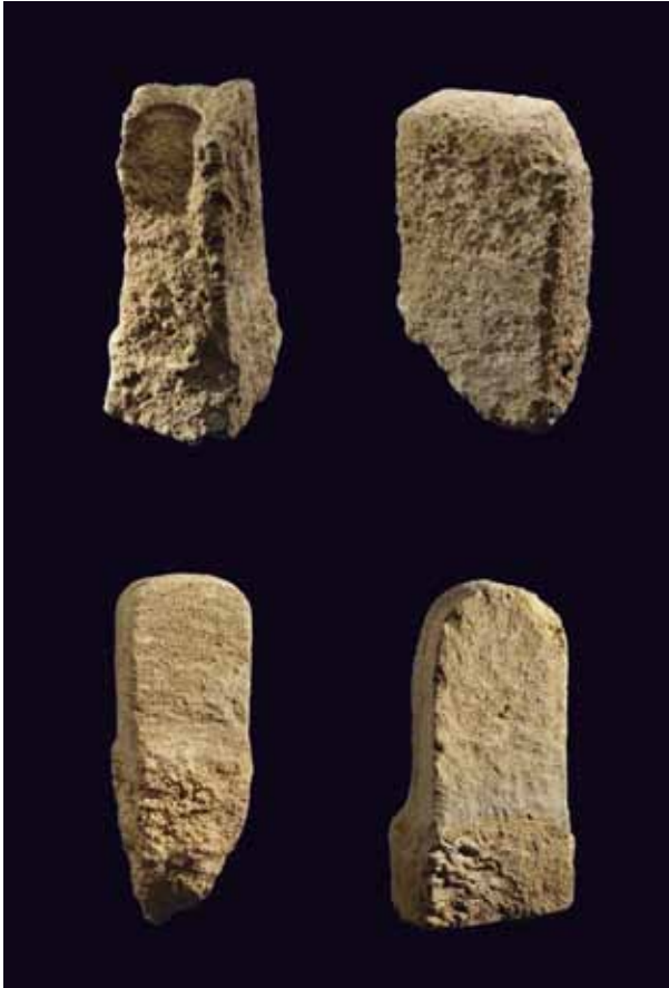
Stèles de l'oppidum de Saint-Blaise à Saint-Mitre-les-Remparts (Bouches-du-Rhône), dépôt au service archéologique municipal de Martigues

Bien avant le développement d'une réelle hiérarchisation sociale et l'essor du processus urbain, ces stèles semblent désigner de véritables géosymboles bornant, animant et structurant le paysage. La plupart de ces lieux de concentration, implantés en un point remarquable du territoire, ont été investis par des habitats à partir du VI e s. av. J.-C. Les populations les reconnaissent