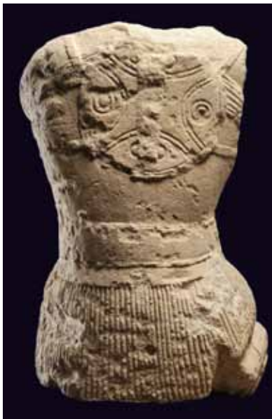
Guerrier de Lattes, (Hérault), dépôt au site archéologique Lattara - musée Henri Prades, Lattes

A côté, la statue du Coutarel reste une œuvre assez méconnue. Une analyse stylistique récente invite à voir deux phases bien distinctes. Dans son état initial, que l'on peut dater du VI e ou du début du Ve s. av. J.-C., un personnage est représenté muni d'un torque et peut-être d'une hache, avec une coiffure à mèche torsadée reprenant étonnamment celle d'un kouros grec. Une deuxième phase, à la fin de l'âge du Fer ou du début de l'Antiquité, met en scènes des animaux sauvages ou domestiques. L'altération ancienne de la face avant laisse envisager la possibilité d'une mutilation ou une désacralisation de l'image.